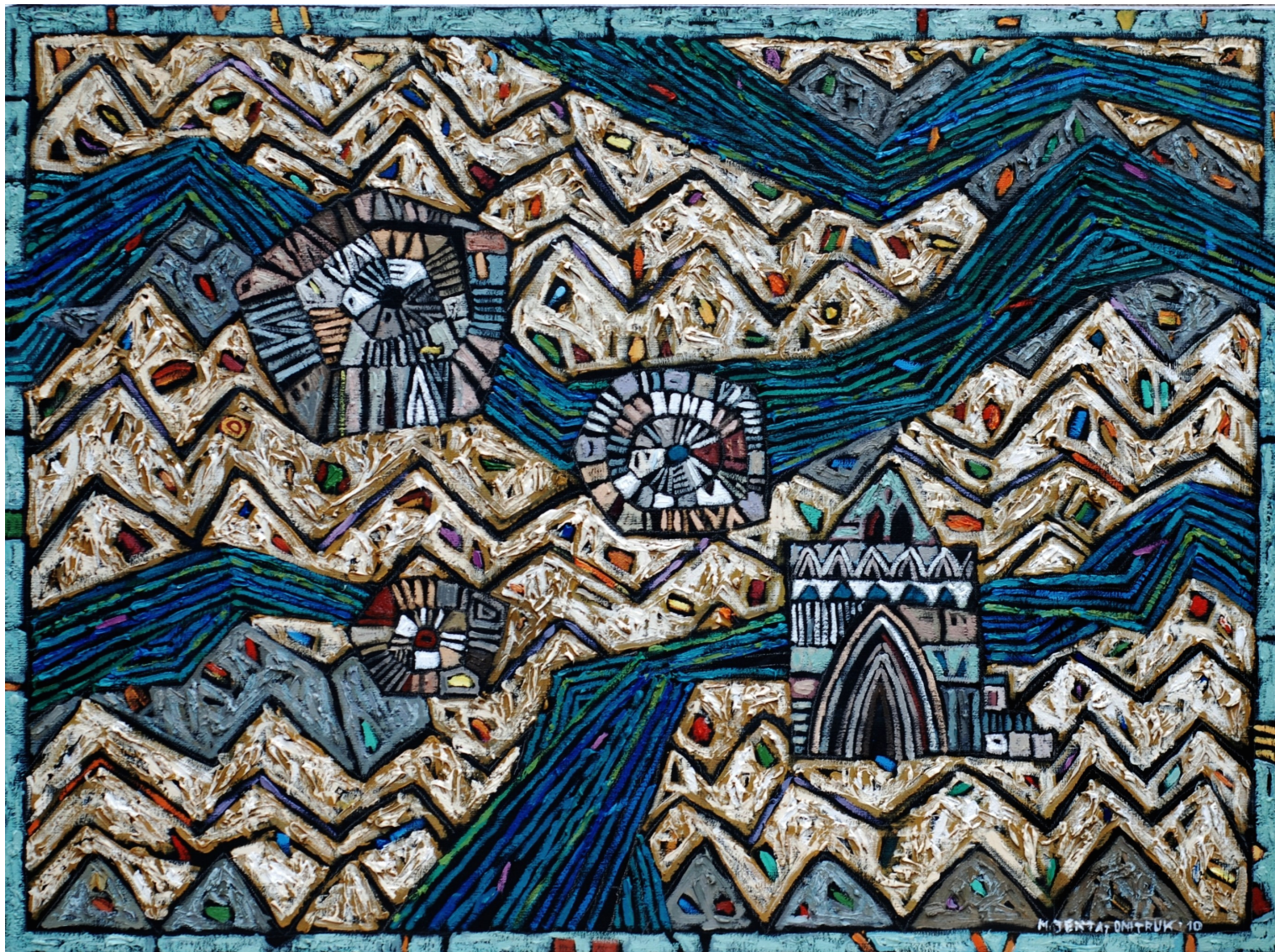
Siódma rzeka , 2010 olej, płótno, 70 x 90 cm