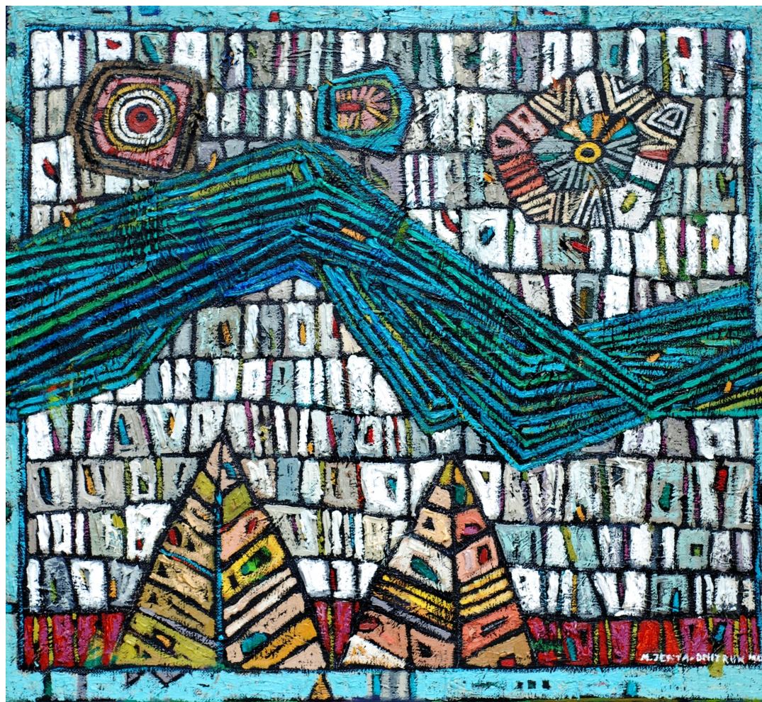
Spacer nad rzeką , 2010 olej, płótno, 50 x 55 cm