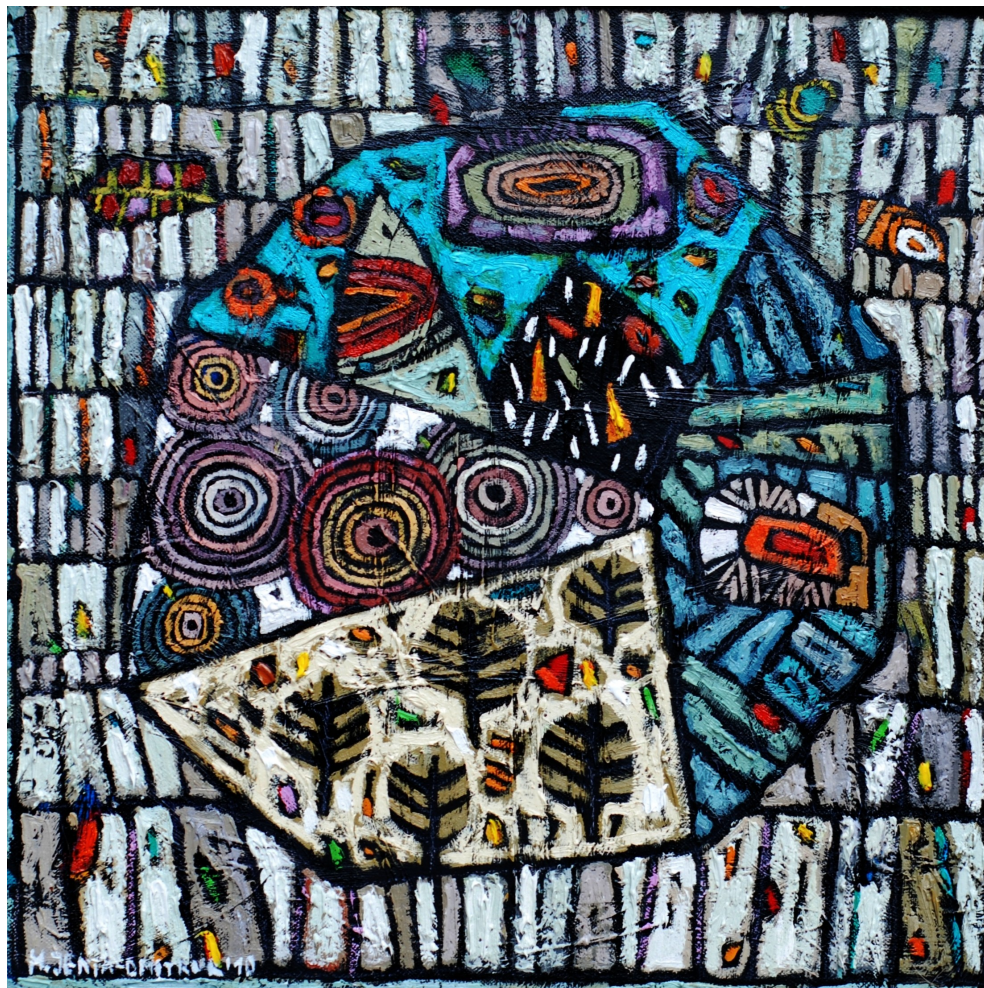
Zimą, dookoła Ciebie , 2010 olej, płótno, 40 x 40 cm