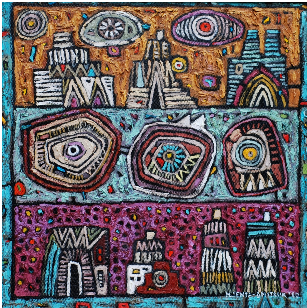
Między świtem a zmierzchem , 2010 olej, płótno, 40 x 40 cm