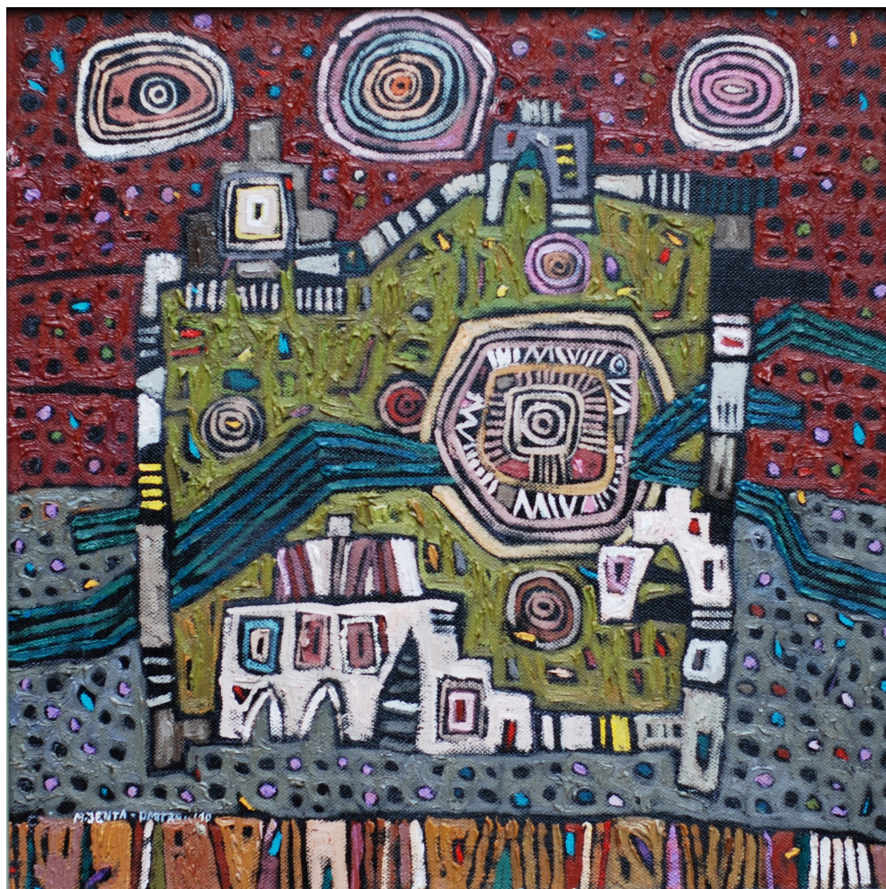
Słońce na zamku , 2010 olej, płótno, 40 x 40 cm