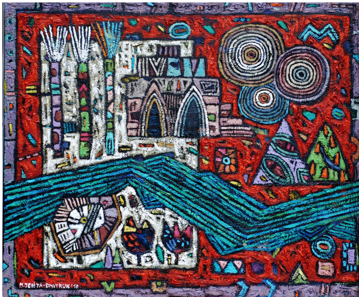
Nad rzeką w czerwonym ogrodzie, 2010 olej, płótno, 50 x 60 cm