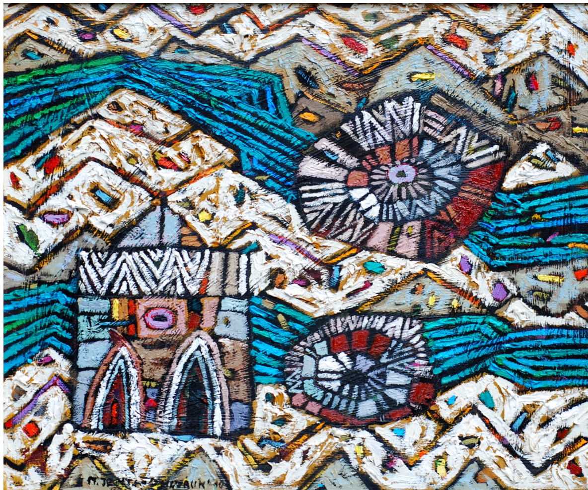
Dwa słońca, dwie rzeki , 2010 olej, płótno, 40 x 40 cm