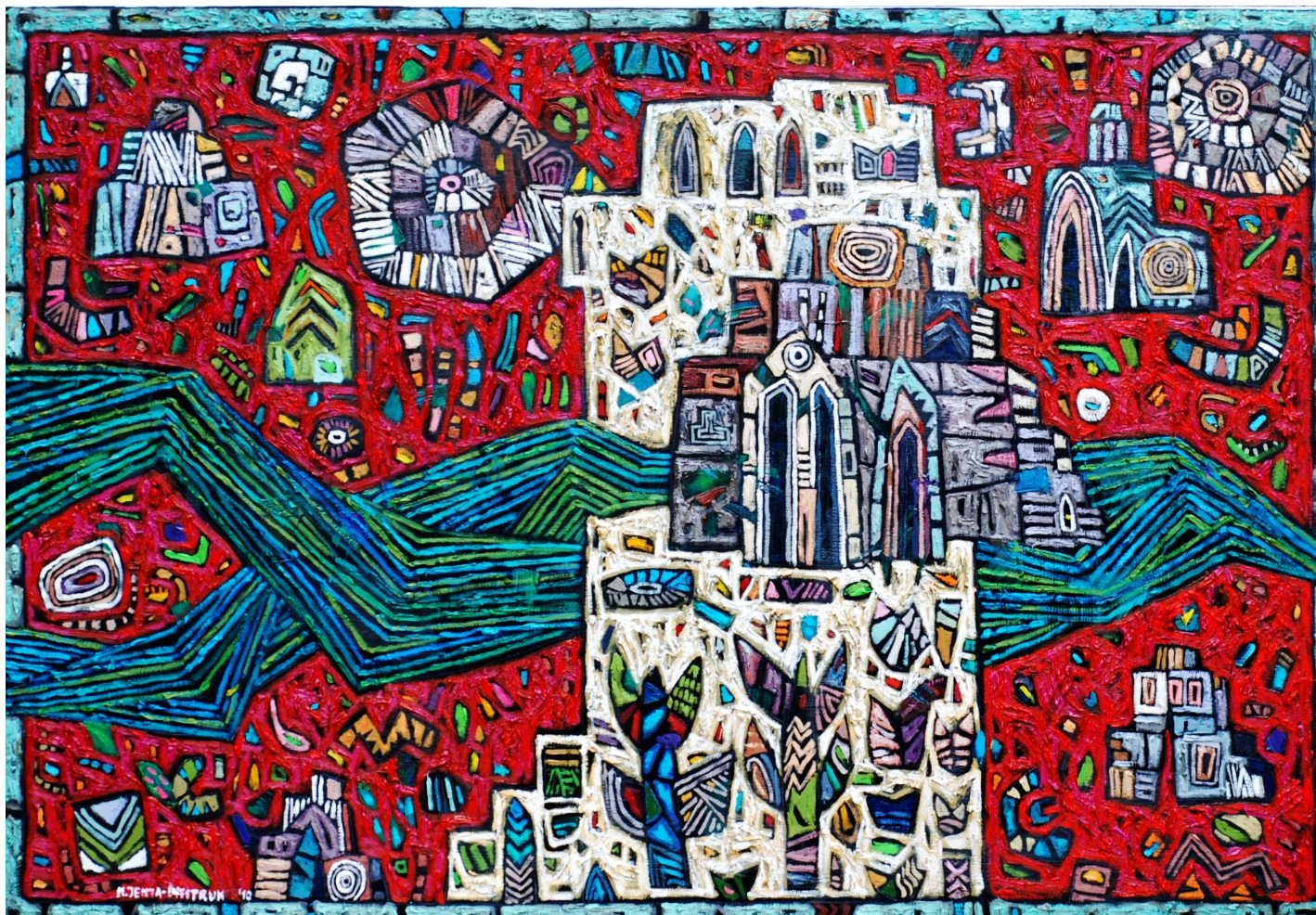
Biała wieża , 2010 olej, płótno, 80 x 120 cm