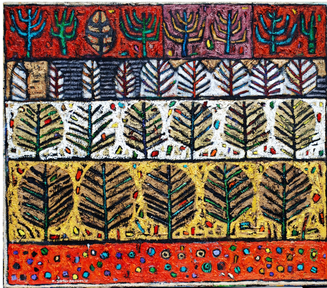
Spacer czerwoną ścieżką , 2010 olej, płótno, 65 x 75 cm