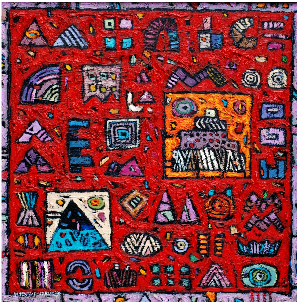
Czerwony sen II , 2010 olej, płótno, 40 x 40 cm