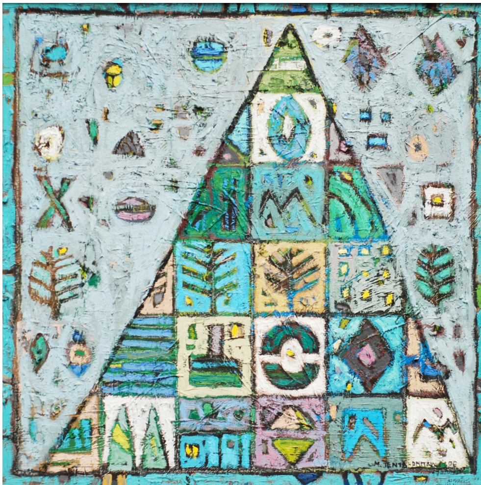
W błękitach , 2006 olej, płótno, 40 x 40 cm