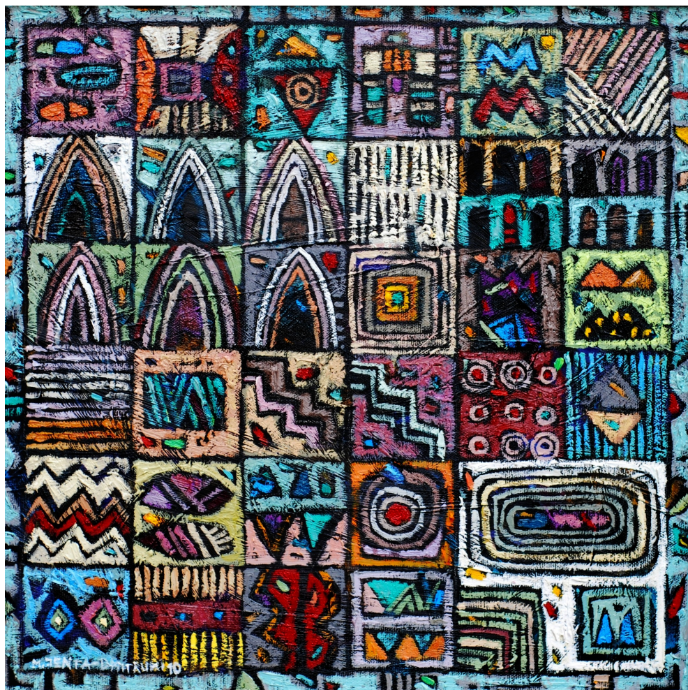
Zamkowe tajemnice , 2010 olej, płótno, 40 x 40 cm