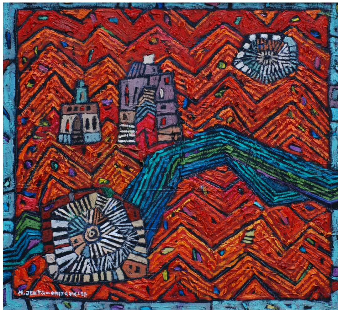
Czerwony sen I , 2010 olej, płótno, 40 x 40 cm