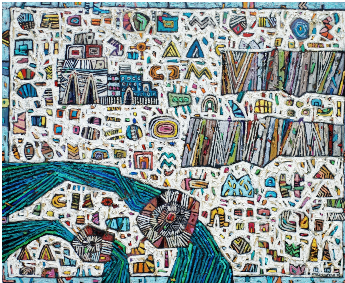
Białe królestwo , 2010 olej, płótno, 81 x 100 cm