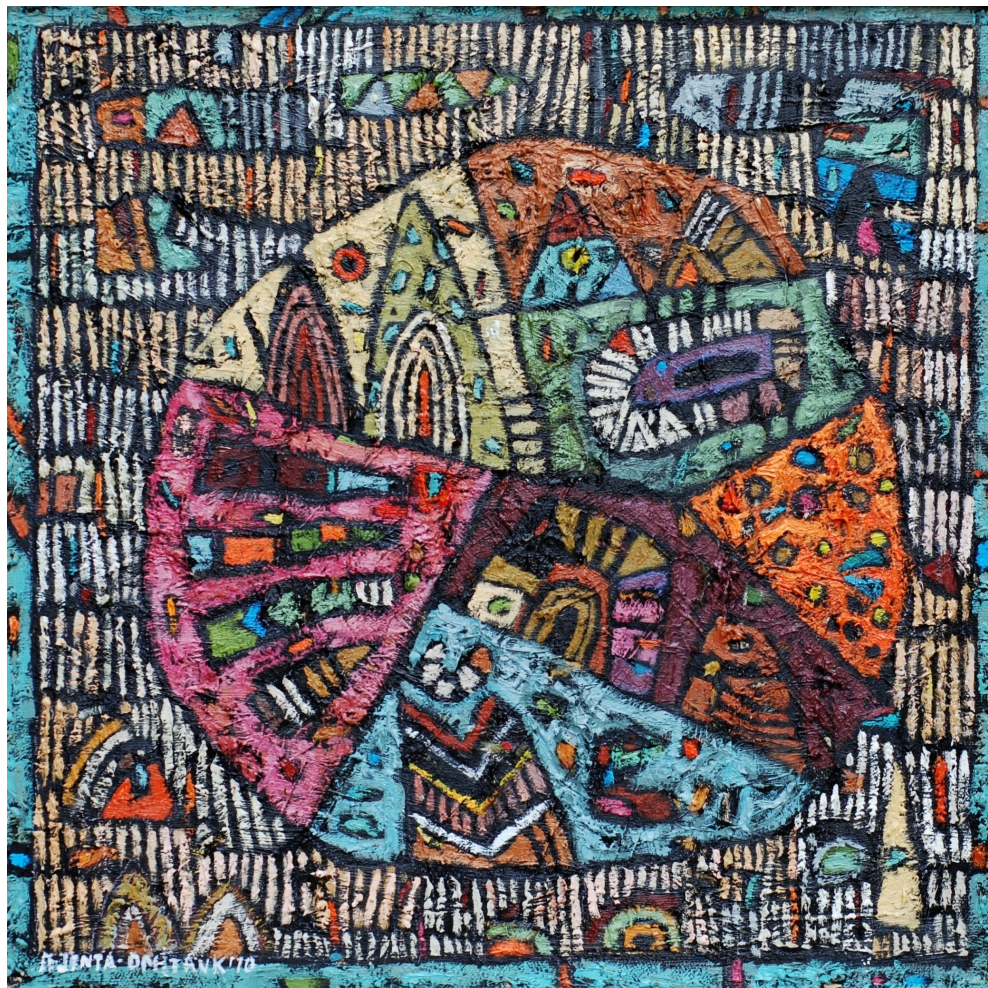
Po różowej stronie świata , 2010 olej, płótno, 40 x 40 cm