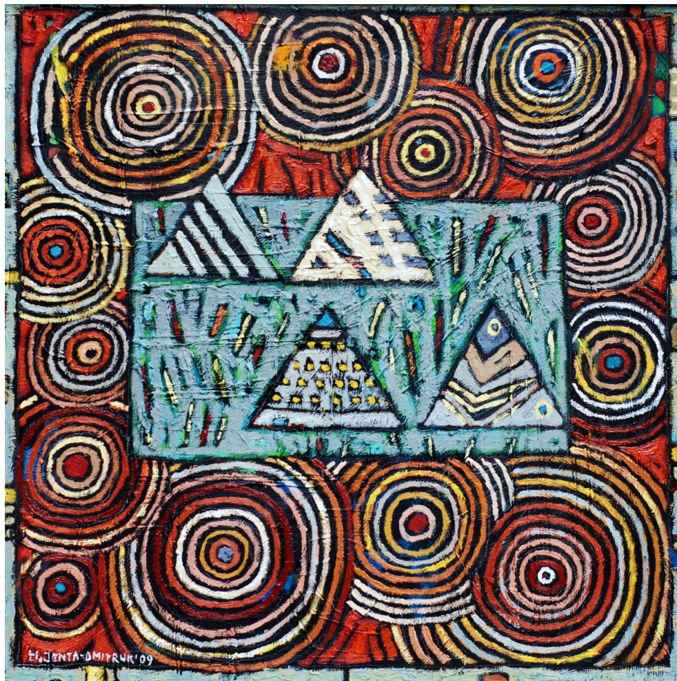
Wigwamy wśród słońc , 2009 olej, płótno, 40 x 40 cm