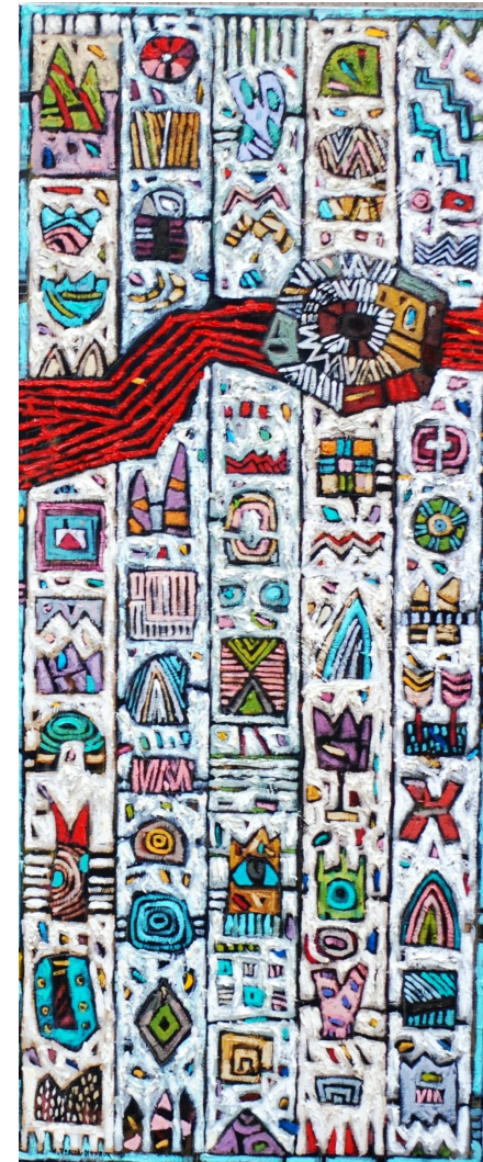
Czerwona rzeka , 2010 (z cyklu "Dwa słońca") olej, płótno, 100 x 40 cm