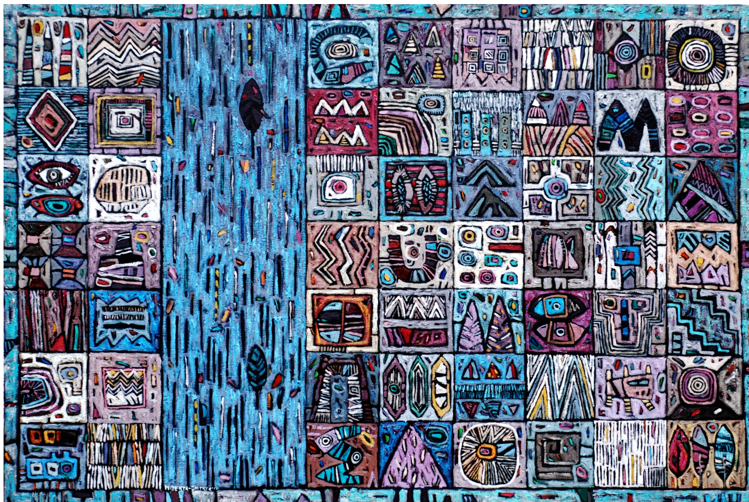
Być jak płynąca rzeka, 2010 olej, płótno, 80 x 120 cm