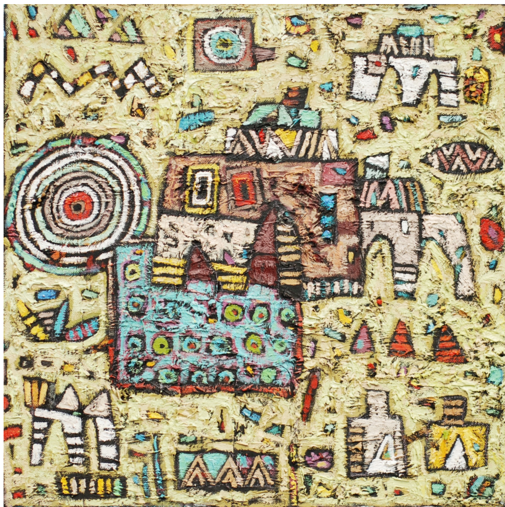
Poranek , 2010 olej, płótno, 40 x 40 cm